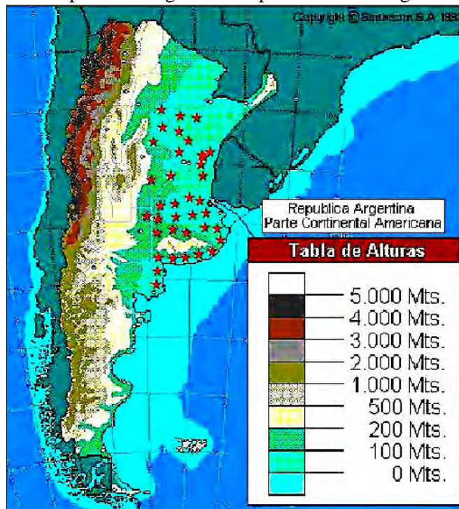
Figura 1. Mapa de distribución espacial de deficiencias de Cu en la República Argentina. Zonas marcadas con estrellas corresponden a regiones con presencia de antagonistas tales como Mo y SO 4

deficiencias de Cu (Figura 1). Una forma segura y relativamente barata de mejorar esta situación es mediante la utilización de suplementos minerales que contengan este elemento.