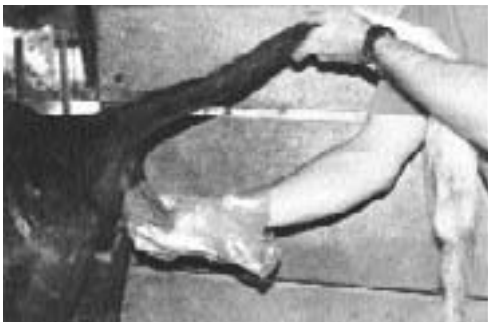
Paso 3: cuando se percibe que el animal se va a defecar, se retira la mano para recibir la materia fecal.