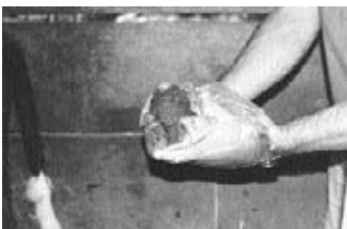
Paso 4: se dispone la bolsa para que contenga la materia fecal.