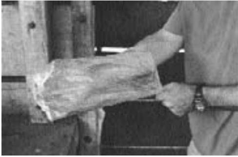
Paso 1: se utiliza una bolsa de plástico a modo de guante y de recipiente.