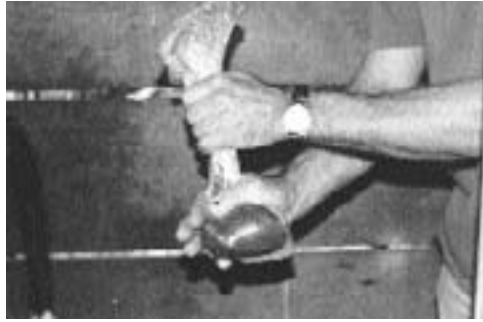
Paso 5: se ajusta la bolsa a la materia fecal, para retirar el aire.