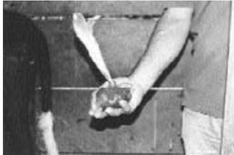
Paso 6: se hace un nudo lo mas cercano posible a la materia fecal para cerrar la bolsa.