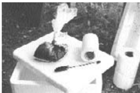
Paso 7: se coloca un rótulo a la bolsa con el número del animal y el día de muestreo.