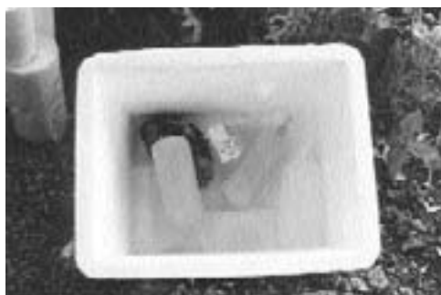
Paso 8: las muestras se envían al laboratorio en recipientes térmicos con refrigerantes.